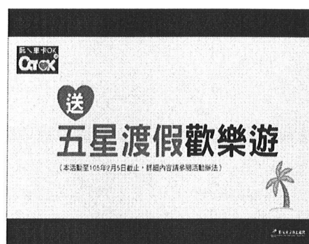
OS：送五星度假歡樂遊

五、以上，「買賣中古車、五星度假歡樂遊」獎勵活動內容，敬請部區「營業副理、區域主任、對應所長」必須向車商及會長宣導知悉。