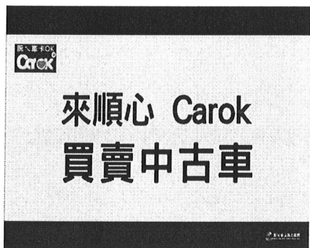
OS：來順心 買賣中古車